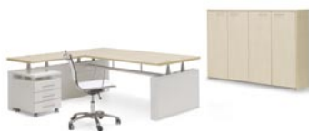
M816GACAC S508GACBI S511GACBI C510GBI