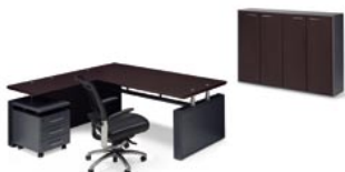
M816GANWE S508GWEAN S511GWEAN C510GAN