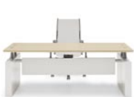
M816GACAC S508GACBI R508GBI