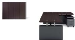
M816GANWE S508GWEAN S511GWEAN C510GAN